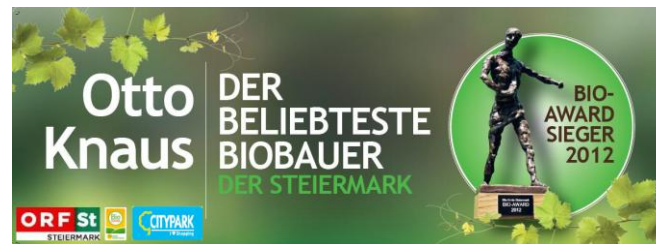
Bio Award Sieger 2012